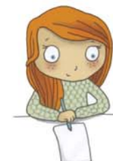
je voudrais écrire, dessiner, colorier