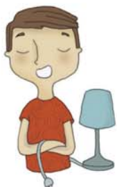
je voudrais éteindre la lumière