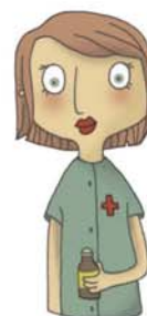
je voudrais voir l'infirmière