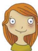
oui je veux