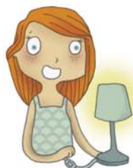
je voudrais allumer la lumière