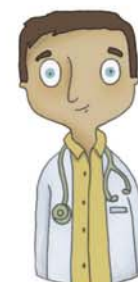
je voudrais voir le docteur