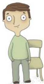
je voudrais me lever