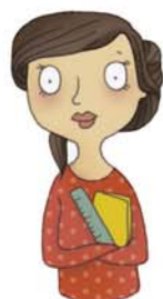
je voudrais voir le maître, la maîtresse