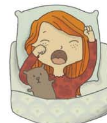
j'ai fait un cauchemar