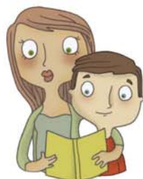
je voudrais que l'on me raconte une histoire