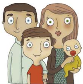
je voudrais voir maman, papa, mon frère, ma soeur