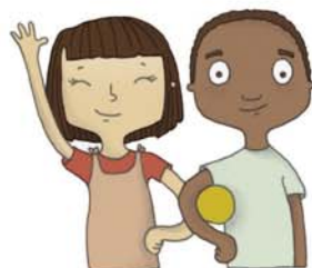
je voudrais voir mes copains