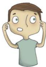
il y a trop de bruit