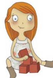
je voudrais jouer