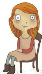
je voudrais m'asseoir