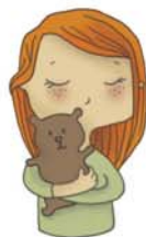
je voudrais mon doudou, ma poupée