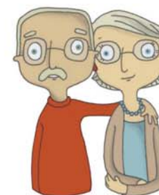
je voudrais voir papi, mamie