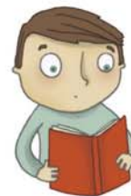
je voudrais lire