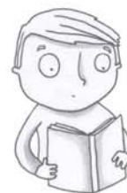
je voudrais lire