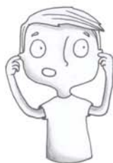
il y a trop de bruit