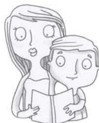
je voudrais que l'on me raconte une histoire