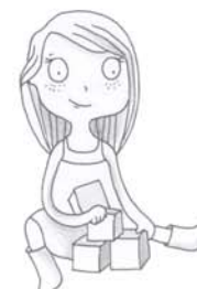
je voudrais jouer