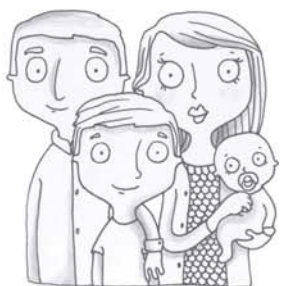
je voudrais voir maman, papa, mon frère, ma soeur