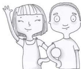
je voudrais voir mes copains