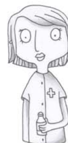
je voudrais voir l'infirmière