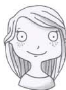
oui je veux