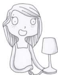
je voudrais allumer la lumière