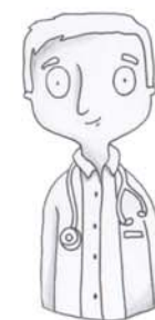
je voudrais voir le docteur