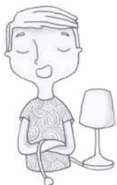
je voudrais éteindre la lumière