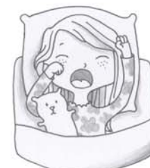
j'ai fait un cauchemar