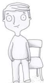
je voudrais me lever