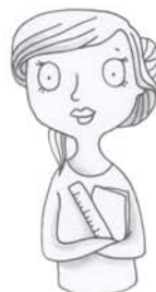
je voudrais voir le maître, la maîtresse