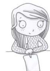
je voudrais écrire, dessiner, colorier