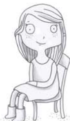
je voudrais m'asseoir