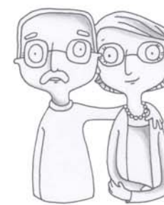
je voudrais voir papi, mamie