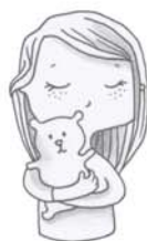
je voudrais mon doudou, ma poupée